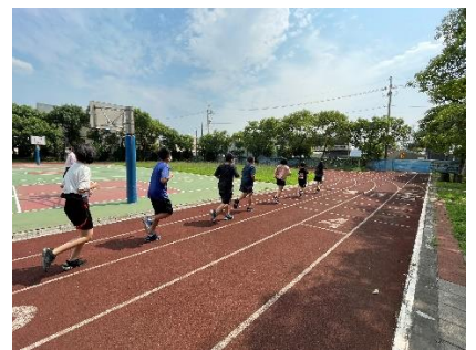
課間活動全校師生慢跑