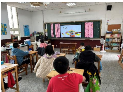
全民健保教育宣導