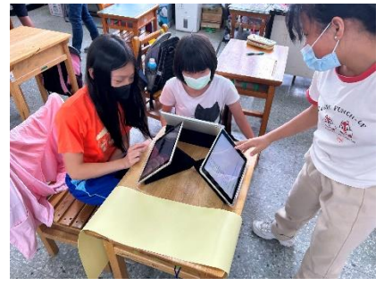
六年級級無菸拒檯課程