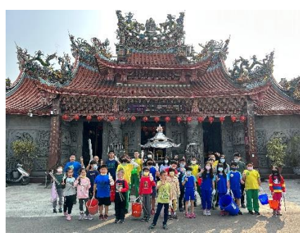
增加戶外授課時數