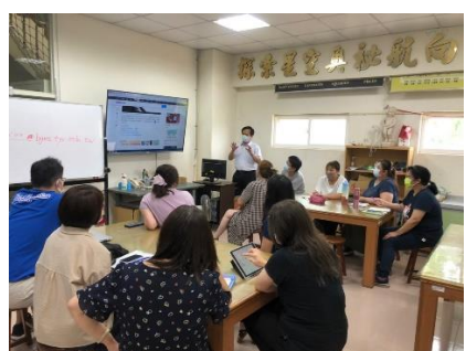
班級性侵害防治課程