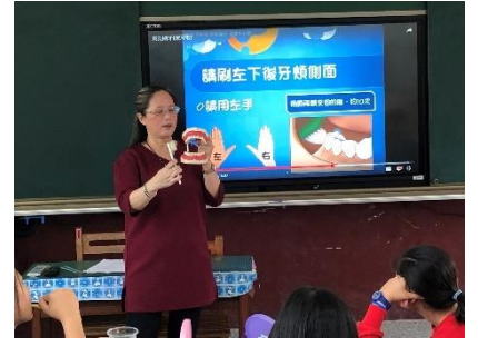
護理師班級貝氏刷牙法教學