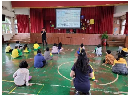
正確用藥朝會宣導