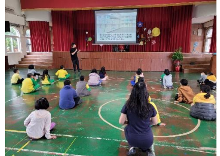
正確用藥朝會宣導