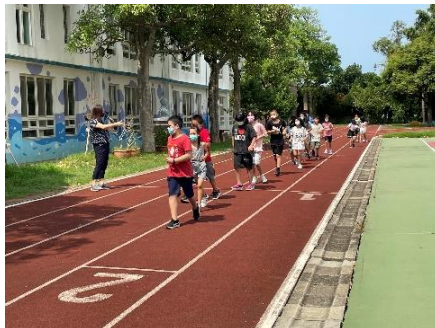
每年辦理體適能檢測