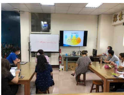
班級性侵害防治課程