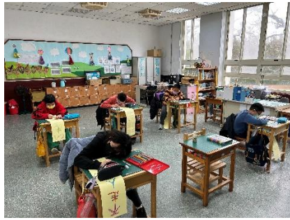
無菸拒檯硬筆字比賽