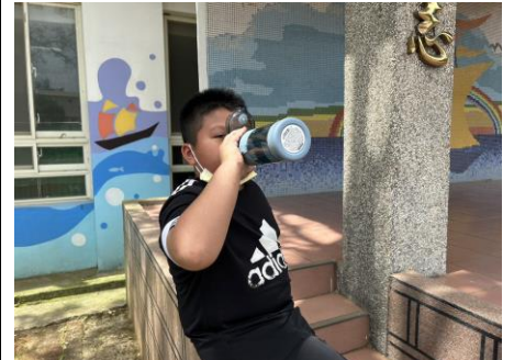
鼓勵學生帶水壺多喝白開水