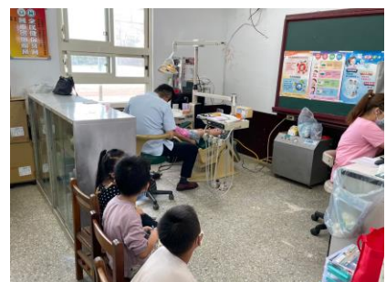
牙醫每月到校為學生診療