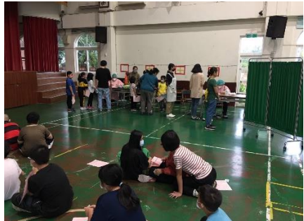
學生做身體健康檢查