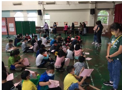
全民健保身體健康檢查