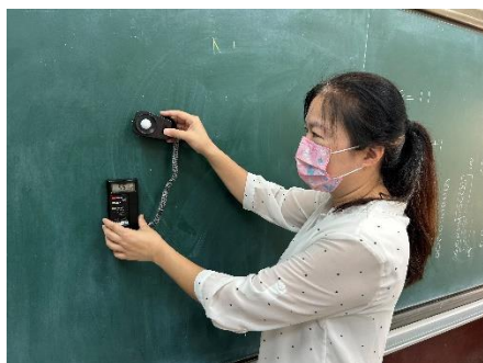
確認班級黑板及座位區照度