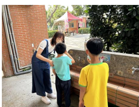
鼓勵牙線使用並實作教學