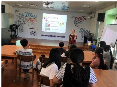
護理師進行視力保健宣導