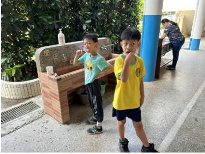
導師積極指導推動餐後潔牙