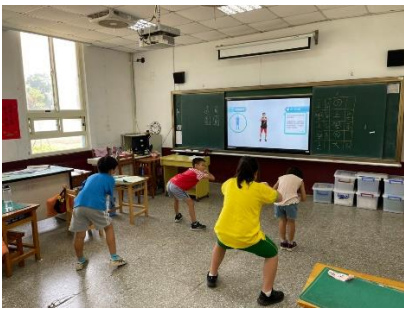
鼓勵學生做健康操