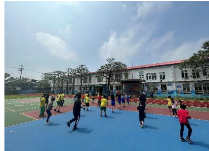
下教室淨空，每天戶外活動