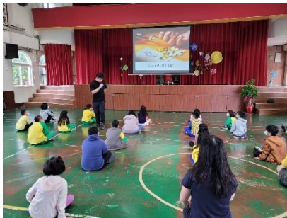
正確用藥朝會宣導