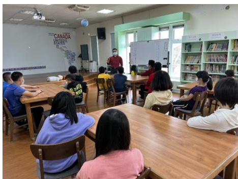
口腔健宣導及實作課程