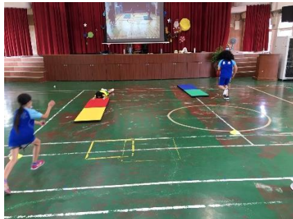
多讓學生在體育課活動