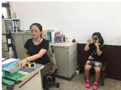
每學期檢查視力並追蹤矯治