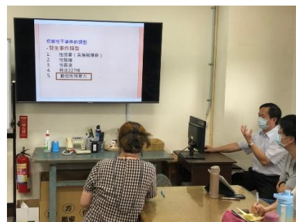
班級性侵害防治課程