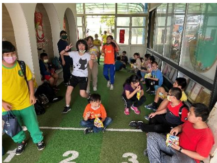
課後照顧學生餐小鐵人運動