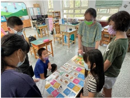
五年級無菸拒檯課程