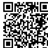
桃園市公立及非營利幼兒園 招生網